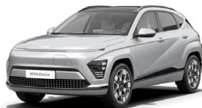
Shimmering Silver Metalická Kombinace s černým lakováním střechy Cena: 17 900 Kč