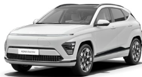
Atlas White Speciální pastelová Kombinace s černým lakováním střechy Cena: 10 000 Kč