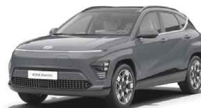
Ecotronic Gray Perleťová Kombinace s černým lakováním střechy Cena: 17 900 Kč