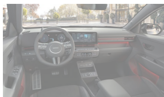
Černý interiér N Line – látkové čalounění sedadel – výhradně pro N Line