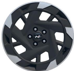
19" kola z lehké slitiny N Line