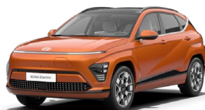
Jupiter Orange Metalická Kombinace s černým lakováním střechy Cena: 17 900 Kč