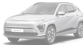
Shadow Grey Speciální pastelová Kombinace s černým lakováním střechy Cena: 17 900 Kč Pouze pro N Line