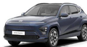
Sailing Blue Perleťová Kombinace s černým lakováním střechy Cena: 17 900 Kč